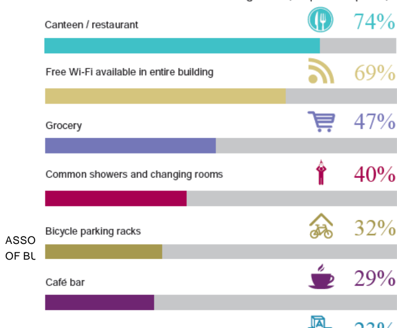
Which amenities should the office building have? (multiple choice question)